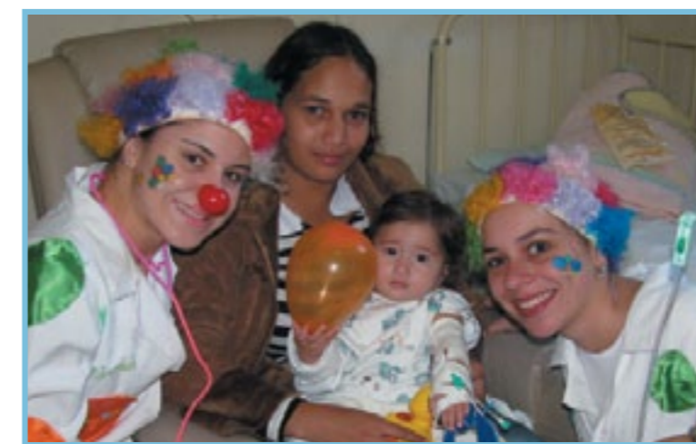
Carinhosas, as estudantes do Unifeg animaram a pediatria do Hospital

As alunas visitaram a pediatria, além das clínicas médica e cirúrgica do hospital local. Lá, inventaram brincadeiras, fizeram encenações pitorescas e arrancaram gargalhadas das crianças e os adultos que encontram-se internados. "Esta atividade visa trazer um pouco de descontração aos pacientes, que passam por procedimentos dolorosos aqui dentro. Já foi comprovado cientificamente que o riso provoca a liberação de substâncias que causam prazer", comentou a