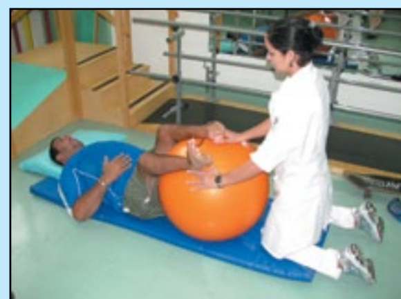
Rapaz recebe tratamento específico para seu problema de saúde