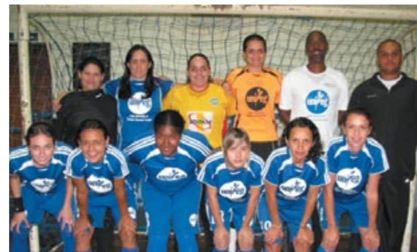
As meninas do Centro Universitário aparecem entre as favoritas à conquista do título de campeãs

Esta foi a 4ª vitória do Unifeg no campeonato, que conta com times de expressão no cenário amador do futsal paulista e mineiro. Agora, a equipe do Centro Universitário conta com doze pontos, tendo feito vinte e seis gols e sofrido quatorze. Além do Unifeg, outras sete entidades esportivas disputam a competição regional. A próxima partida das guaxupeanas será dia 27 próximo, em São João da Boa Vista, contra o Cube Atlético Ferreirense.