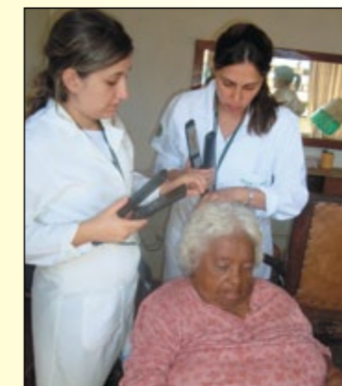
Universitárias produzem moradora do Lar São Vicente