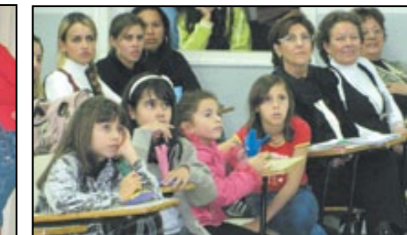
Crianças e adultos se rendem à magia da arte oferecida pela comissão organizadora