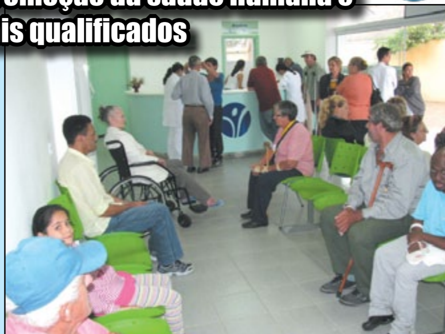
O número de atendimentos aumenta cada vez mais na entidade

Entre os estagiários, a experiência obtida com as atividades práticas são enriquecedoras para a formação profissional. "É muito importante praticar o que se aprende na teoria, pois os resultados são gratificantes. Junto a isto, há o fato de ver os pa-