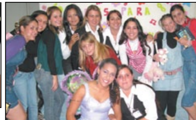
Os estudantes que participaram de uma das encenações artísticas da primeira noite