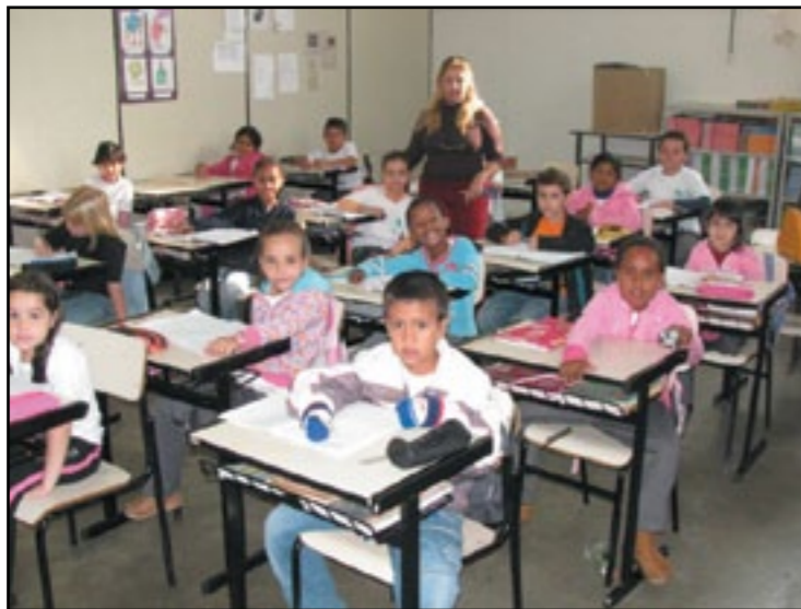
Na Escolinha, a qualidade de ensino acompanha os moldes do Colégio Dom Inácio

A Unidade II está entre os vários projetos de cunho social mantidos pela Fundação Educacional Guaxupé. Criada em 1999, com o objetivo de assistir crianças carentes, a entidade é reconhecida pela boa qualidade do ensino oferecido, além dos benefícios dispensados aos estudantes e seus familiares.