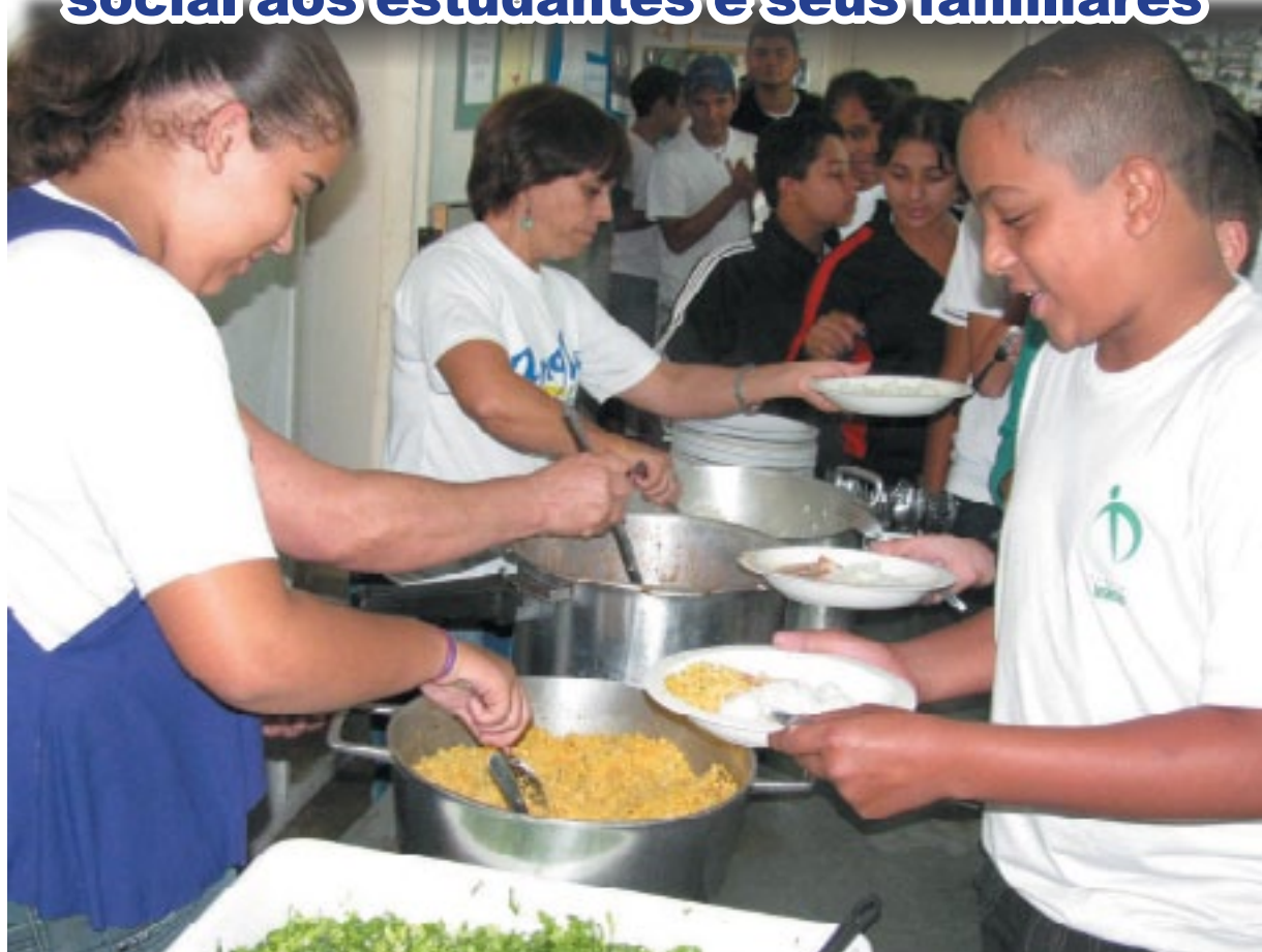
A alegria dos alunos é visível na cantina da escola