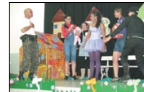
Alunos do 3º período interpretam a peça "Maria do Céu e suas Magias"

Conforme a programação, a 5ª Semana de Pedagogia do Unifeg destaca, ainda, as palestras "A