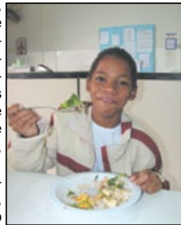
Descontraído, garoto sorri enquanto se alimenta

Quanto ao aspecto educacional, o projeto do reitor do Centro Universitário da Fundação Edu-