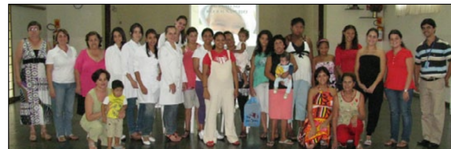
A participação do Unifeg é representada pelos cursos de Enfermagem e Serviço Social