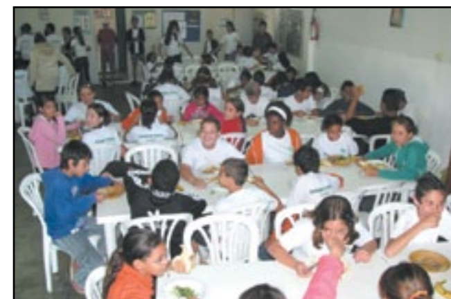
A movimentação das crianças na cantina da Unidade II